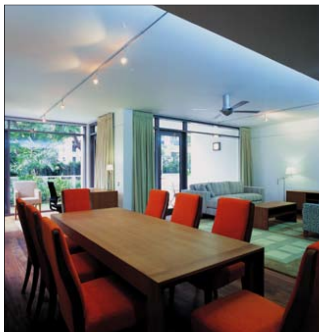
(หน้า 71) กลุ่มห้องพักอาศัยของเจ้าหน้าที่สถานทูตอังกฤษที่ซ่อนตัวอยู่ในสวนเขียวกลางเมือง (ซ้าย ขวา) สเปซภายในของหน่วยพักอาศัยที่นำเอาเพดานสูงกับ double space มาเป็นตัวช่วยในการระบายอากาศ

เพียงแค่มองเห็นผลเท่านั้นจะทำให้เราได้มีโอกาสเดินเข้าไปในสถานทูตอังกฤษประจำประเทศไทย หนึ่งคือเข้าไปขอวีซ่าเพื่อจะเดินทางไปอังกฤษ กับสองการไปเที่ยวงานเพลินจิตแฟร์ซึ่งอย่างหลังจะเป็นการเดินทางไปที่มักจะมีสง่าผ่าเผย และเป็นโอกาสที่พิเศษกว่าอย่างแรก เพราะนอกจากจะได้เข้าไปเดินช้อปปิ้งกินดื่ม ชมดนตรีอังกฤษอย่างสนุกสนานแล้ว งานสถาปัตยกรรมของอาคารภายในนั้นก็มีอายุไม่ต่ำกว่า 40 ปี และสวนเขียวสวยๆก็เป็นฉากหลังของงานเลี้ยงช่วงกลางวันใจกลางเมืองอย่างในย่านชิดลมได้ประทับใจกันไปอีกนาน แต่ขอโทษที่หากจะบอกว่าโอกาสอย่างนั้นคงไม่มีอีกแล้ว เพราะงานเพลินจิตแฟร์ได้ถูกย้ายไปที่สนามเสือป่าด้วยชื่อเดิม หรือแม้แต่การเข้าไปขอวีซ่าที่จะได้เห็นแคว้นอาคารหลังเล็กๆห้องน้ร่อที่เต็มไปด้วยคิวผู้คน และแสงไฟฟลูออเรสเซนต์สว่างๆ พร้อมอาคารเล็กๆน้อยๆวิเศษผ่านหรือไม่น่าจะเป็นเพียงโอกาสเดียวที่จะทำให้คนธรรมดาอย่างเราได้เดินเข้าไปในอาณาเขตของสถานทูตแห่งนี้ก็ถูกย้ายไปประจำการอยู่แถวราชดำริไปแล้ว